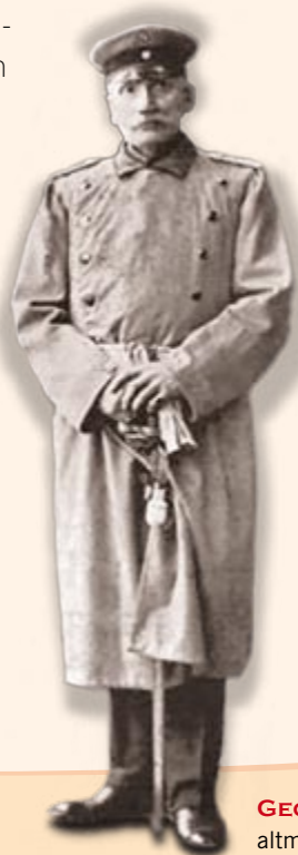
GEGR. 1902 altmann-druck GmbH

Ob Visitenkarten, Briefbogen, Prospekte, Flyer, Plakate, Presse-mappen, SD-Sätze, Postkarten, Mailings, Geschäftsberichte, Kalender, Blöcke oder Bücher - das Team von altmann-druck ist dafür ihr richtiger Ansprechpartner.